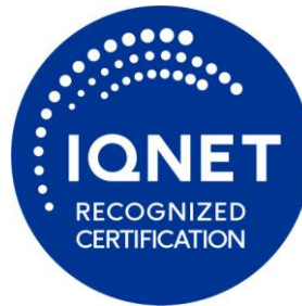
Μπλε “PANTONE” 661

τα οποία πρέπει υποχρεωτικά να συνοδεύονται από την επωνυμία του πιστοποιημένου οργανισμού, τον αριθμό του Πιστοποιητικού Συμμόρφωσης, την περίοδο ισχύος του, το πρότυπο με βάση το οποίο έχει γίνει η πιστοποίηση του Συστήματος Διαχείρισης και την ένδειξη ΠΙΣΤΟΠΟΙΗΜΕΝΟ ΣΥΣΤΗΜΑ ΔΙΑΧΕΙΡΙΣΗΣ: